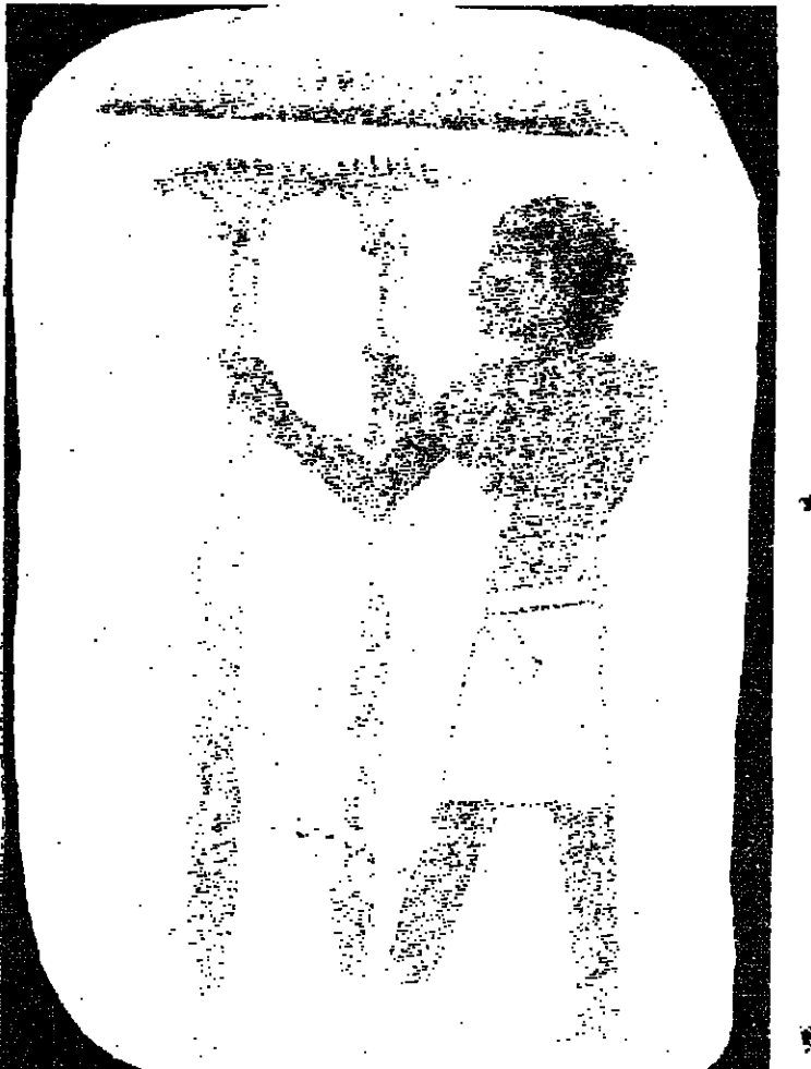
يعد متحف بوسطن للفنون الجميلة إلى مصر تسع قطع من لوحات عائلة آل عهد الملكة الجديدة في القرن الخامس عشر قبل الميلاد، وكان المتحف حصل على هذه القطع من تلخيز في استرداد عام ١٩٧٨ بسعر لم يتكف عنه وجاء قرار إعادة اللوحات الفرعونية إلى مصر بعد أن تأكد لإدارة المتحف أن هذه اللوحات مسروقة. - بوسطن - ١ ف ب